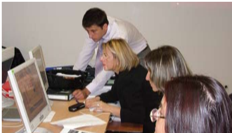
Тук съдебни служители се учат как да използват програмата "PowerPoint" за създаване на презентации, за да подобрят уменията си за преподаване.

НИП се радва на огромен успех по редица причини. Като цяло устойчивостта му почива на вниманието, което се отделя на разработването на програми и учебни планове, стратегическото планиране, теорията за обучение на възрастни и интензивната работа с обществеността, за да може НИП да е в съзвучие с най-новото и най-доброто в съдебната система в България.