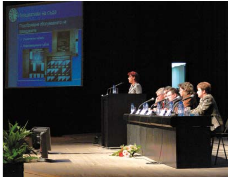
Петима председатели на съдилища-партньори на ИУСС по време на представяне на Националната конференция на съдиите през 2005 г., посветено на текущата работа на съдилищата, ръководени от тях, по Плана за подобряване на работата на съда.

Един от стратегическите подходи на ИУСС и ПРСС е използването на примери с цел насърчаване на стремежа към подобрене в съдебната система в България. Голяма част от работата бе с 32-те съдилища-модели и съдилища-партньори, но също така и с Висшия съдебен съвет в качеството му на мост между тези съдилища и останалите. Интензивно се работи и с Националния институт на правосъдието (НИП) като основната институция, която предоставя обучение. В проектите акцент се постави и върху плановете за обучението по места, с помощта на които съдилищата в цялата страна могат да се свържат с НИП чрез обучителите – съдии и съдебни служители – по места.