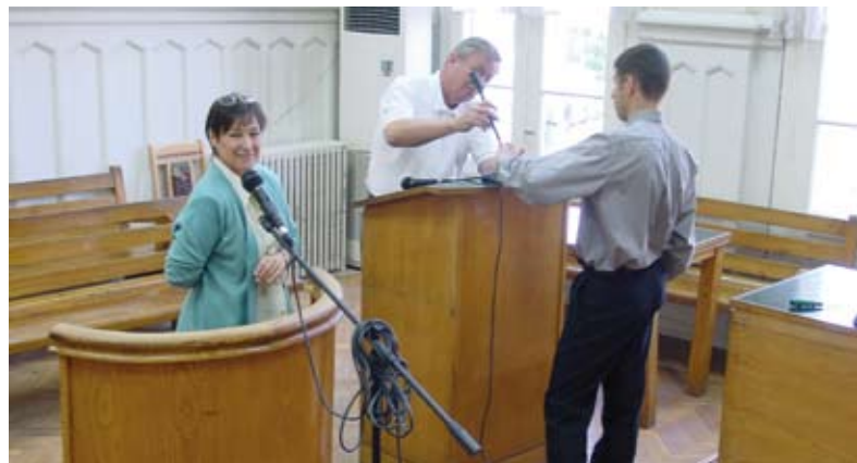
Служители на ИУСС на ААМР (в центъра и вдясно) помагат на Окръжен съд – Шумен при инсталирането на системата за паралелен аудиозапис в съдебна зала.

Някои от ключовите области на съдействие са: автоматизираната система за управление на делата (АСУД) и сървърите за нея, компютърни конфигурации, разработване на Интернет страници на съдилища за подобряване достъпа на обществеността, оборудване за водене на паралелен аудиозапис на съдебни заседания с оглед постигане на по-точни протоколи, както и техника за демонстрация на вещественни доказателства с мултимедийно оборудване към нея. Резултатът са съвременните и ефективни съдилища, съдебните служители, които разполагат с нужните средства за предоставяне на по-добро обслужване на гражданите, както и възможността ръководителите да проследяват по-лесно движението на делата и процеса на правораздаване.