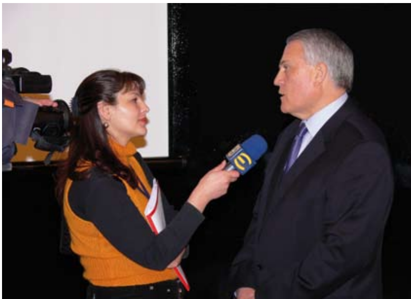
Репортер от телевизия "Европа" провежда интервю с председателя на Върховния касационен съд след пресконференцията на откриването на Втората национална конференция на съдиите в България през м. ноември 2005 г.

Подобряването на представата за съдебната система е цел, която пронизва всички компоненти на програмите на ПРСС и ИУСС. Силата на съдебната система се крепи на общественото доверие. Така, ААМР работи за повишаване на обществената информираност и доверието в работата на съдилищата с помощта на различни дейности. Подобренията в съдебната администрация, развитието на съдебните институции като ВСС и НИП и установяването на политики и закони се подкрепят и от усилия за повишаване на познанията и доверието в съдебната система. В съответствие с обхватната информационна кампания на ИУСС се организират обучения за говорители на съдебни органи и за медиите, работи се със съдилищата за изграждане на доверие и се подкрепя отразяването в медиите на работата на съдилищата-партньори и съдебните институции. Така, крайният резултат е повишаването на информираността на обществеността и по-висока ангажираност на гражданското общество със съдебните реформи и текущото развитие на съдебната система.