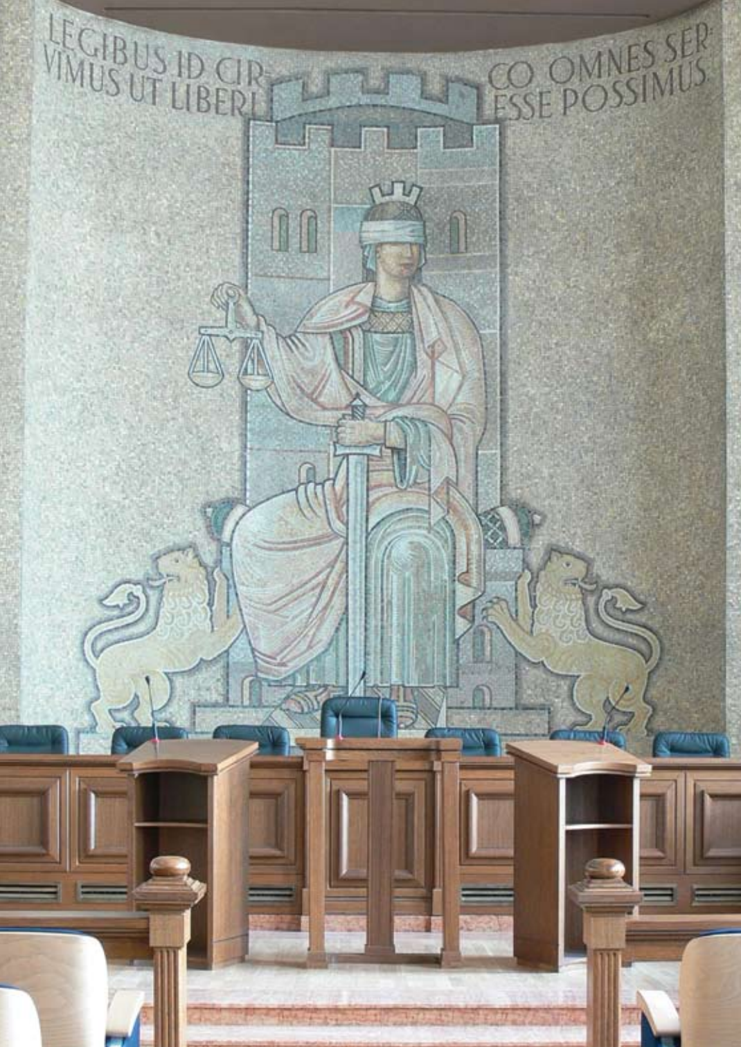
Съдебната палата в София